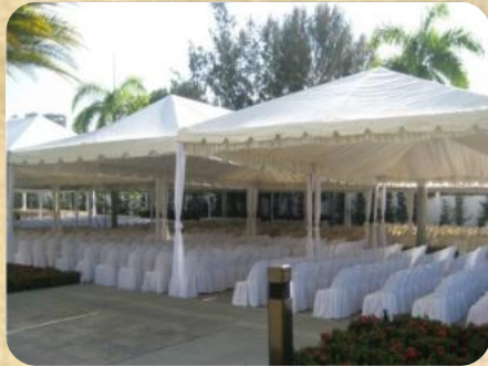
Stand 3x3 m