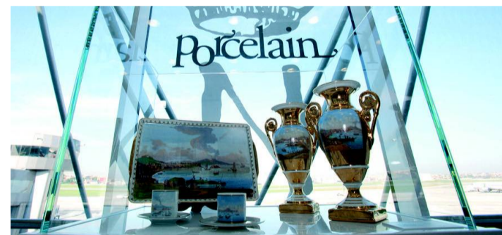
Una teca della rassegna Porcelain